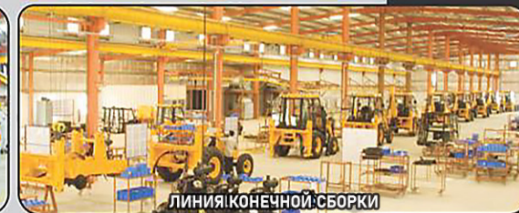
ЛИНИЯ КОНЕЧНОЙ СБОРКИ