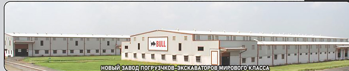
НОВЫЙ ЗАВОД ПОГРУЗЧКОВ-ЭКСКАВАТОРОВ МИРОВОГО КЛАССА