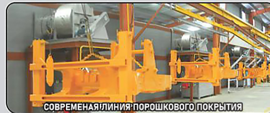
СОВРЕМЕННАЯ ЛИНИЯ ПОРОШКОВОГО ПОКРЫТИЯ